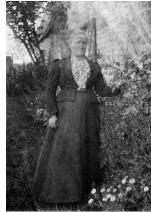
Vitalie Cuif-Rimbaud 1825-1907