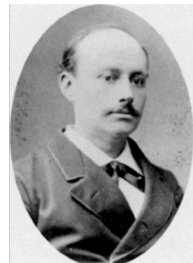
Paul Demeny 1844 - 1918