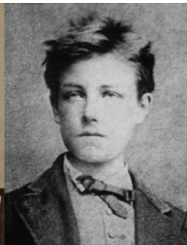
Arthur Rimbaud 1854-1891