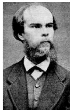
Paul Verlaine 1844 -1896