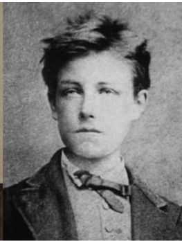
Arthur Rimbaud 1854-1891