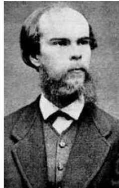
Paul Verlaine 1860-1917