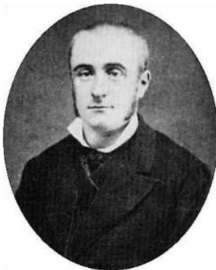
Ernest Delahaye 1860-1917