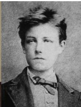
Arthur Rimbaud 1854-1891