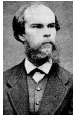
Paul Verlaine 1860-1917