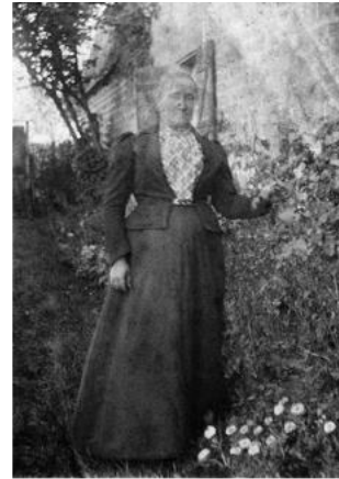
Vitalie Cuif-Rimbaud 1825-1907