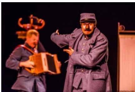
Le petit Poilu Illustré EXTRAIT