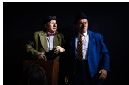
Le petit résistant illustré EXTRAIT