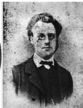
Georges Izambard 1848 - 1931