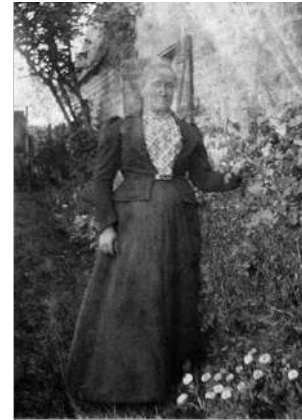
Vitalie Cuif-Rimbaud 1825-1907