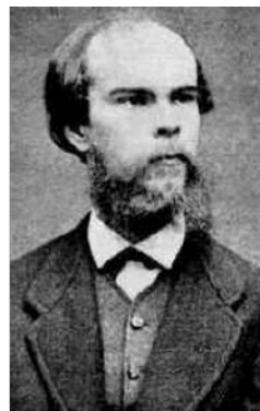
Paul Verlaine 1844 -1896