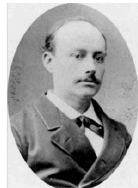
Paul Demeny 1844 - 1918